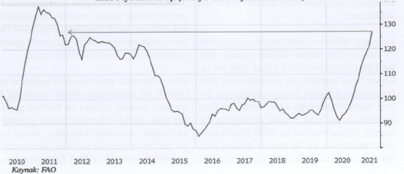
Gıda Fiyatları Artışı (Dünya Gıda Fiyatları Endeksi)

Salgının emekçiler üzerindeki olumsuz etkilerini katmerlendiren gelişmelerden birisi, dünyada gıda fiyatlarındaki artışın pandemi