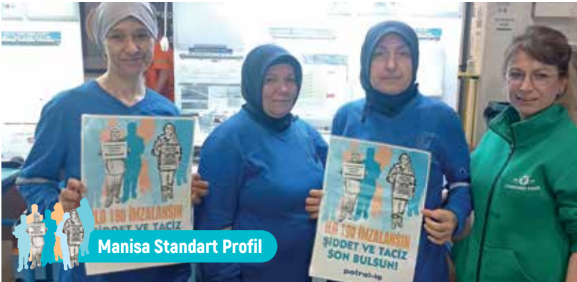
Manisa Standart Profil