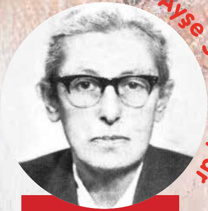
Ayşe Saffet Alpar