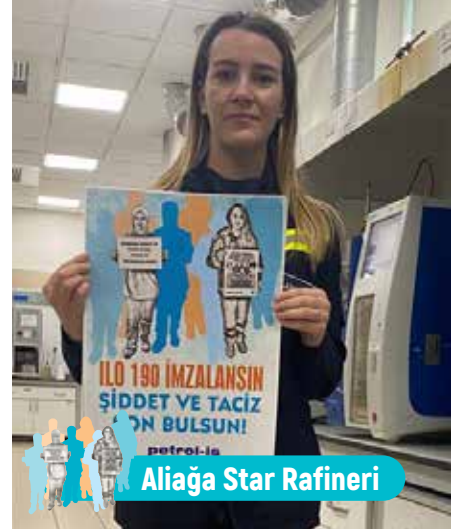
Aliğa Star Rafineri