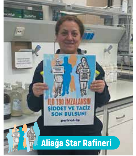
Aliğa Star Rafineri