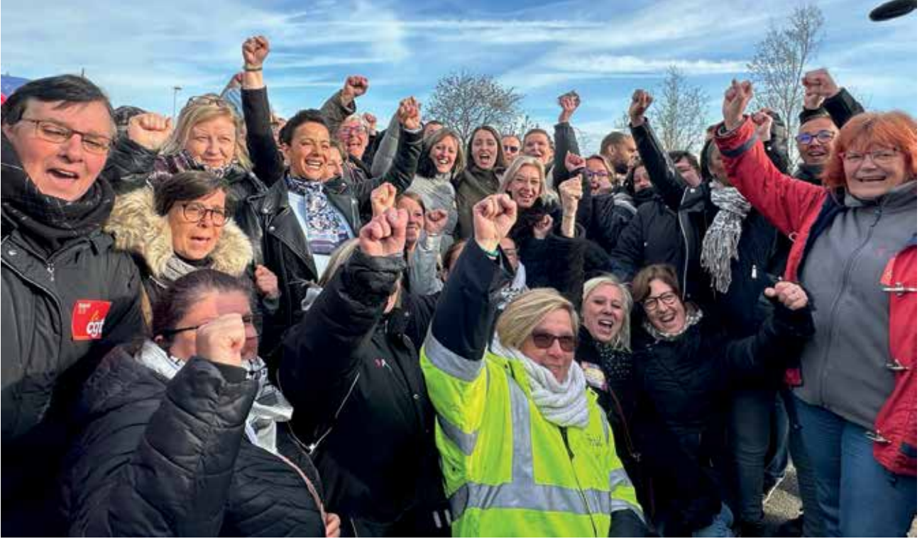
Fotoğraf: CGT genel sekreteri Sophie Binet grevci işçilerle birlikte.

Vertbaudet, Fransa'nın kuzeyinde kurulu, bebek, çocuk ve hamile giyimi üzerine üretim yapan bir firma. Ürünleri dünyanın bir çok ülkesinde satılıyor. Firmada çalışan yaklaşık iki yüz işçinin tamamına yakını kadın. Dünyanın her yerinde kadın işçilerin kaderi aynı, bir bölümü yirmi yıldır aynı yerde çalıştığı halde asgari ücret alıyor. İşyerinde cinsiyet ayrımcılığı yoğun olarak yaşanıyor. Durum böyle olunca, direniş kaçınılmaz olmuş. Mart 2023'ten beri yetmiş iki kadın işçi, insana yakışır iş ve ücret için, işyerindeki cinsiyetçi tutuma karşı, kolluk kuvvetlerinin kötü muamelelerine rağmen fabrika önünde direndiler ve sonunda kazandılar.