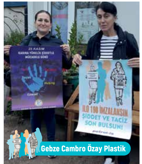
Gebze Cambro Özay Plastik