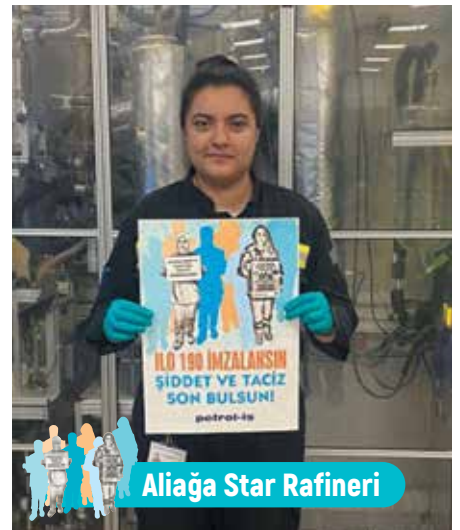
Aliğa Star Rafineri