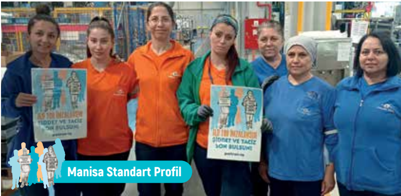
Manisa Standart Profil