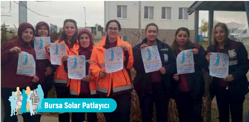
Bursa Solar Patlayıcı