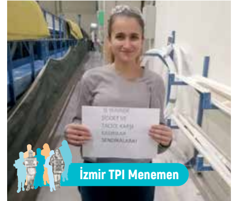
İzmir TPI Menemen