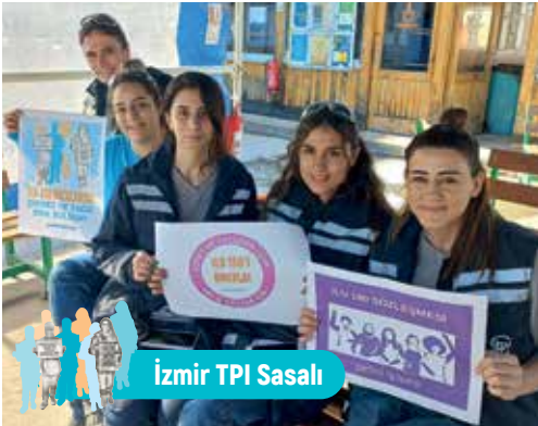
İzmir TPI Sasalı