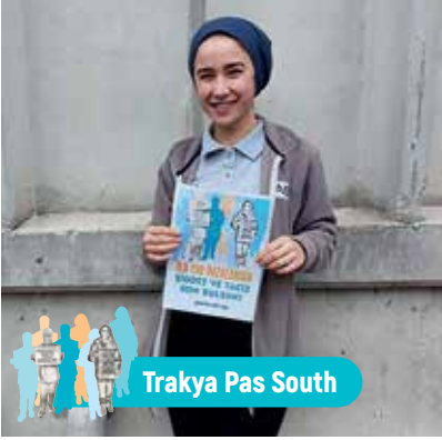
Trakya Pas South