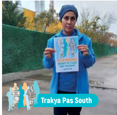
Trakya Pas South