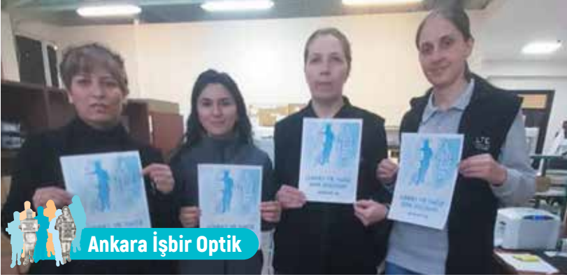
Ankara İşbir Optik