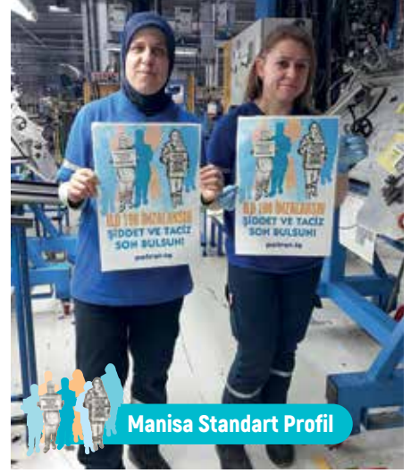
Manisa Standart Profil