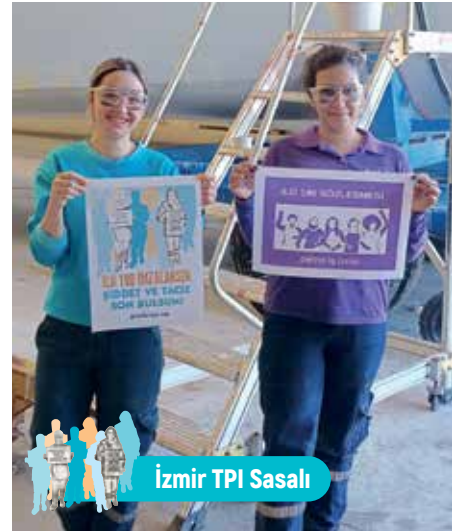
İzmir TPI Sasalı