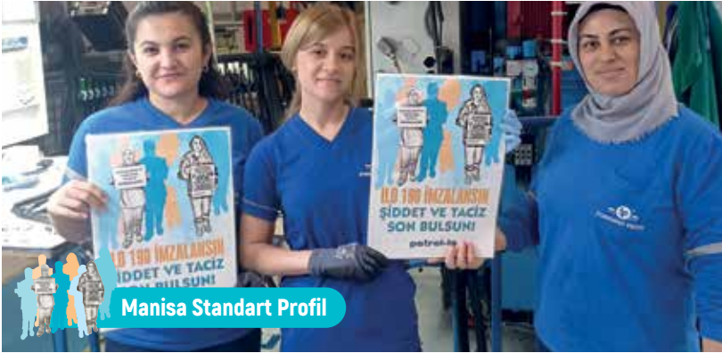
Manisa Standart Profil