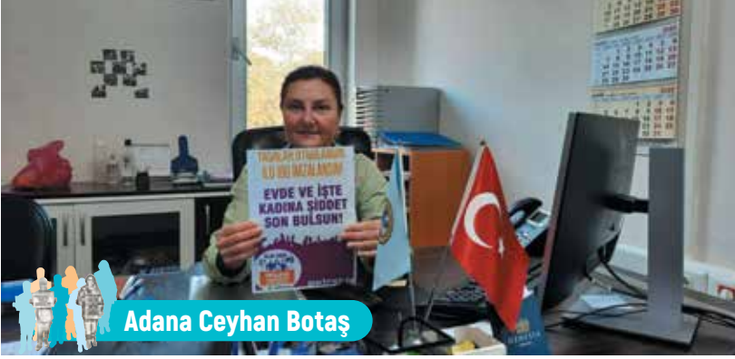
Adana Ceyhan Botaş