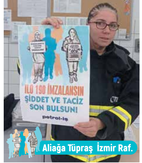
Aliğa Tüpraş İzmir Raf.