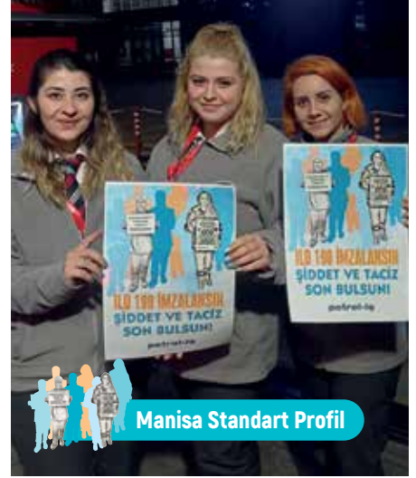
Manisa Standart Profil