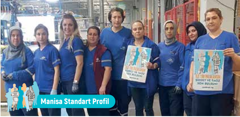
Manisa Standart Profil