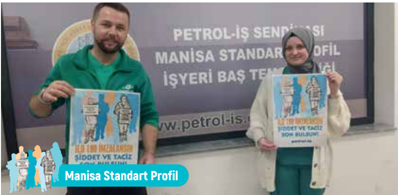
Manisa Standart Profil