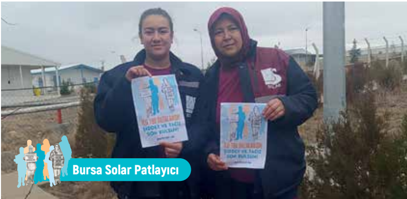
Bursa Solar Patlayıcı