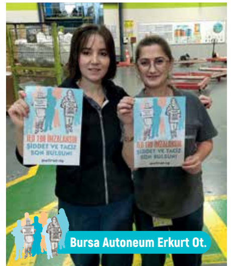
Bursa Autoneum Erkurt Ot.