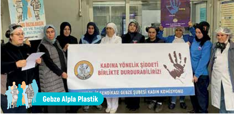
Gebze Alpla Plastik