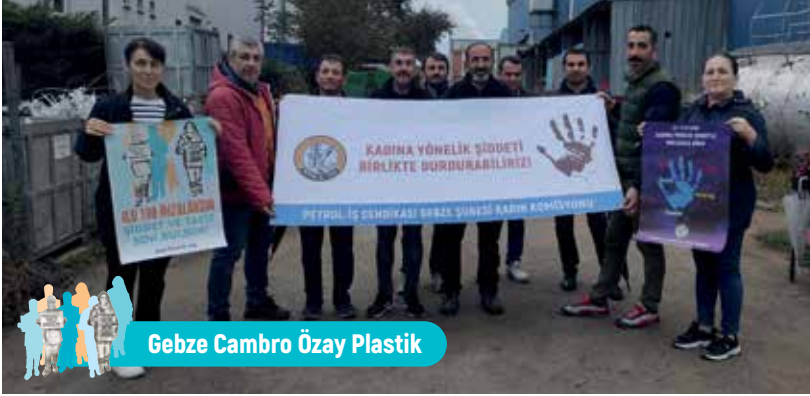
Gebze Cambro Özay Plastik