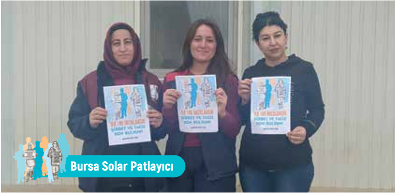
Bursa Solar Patlayıcı