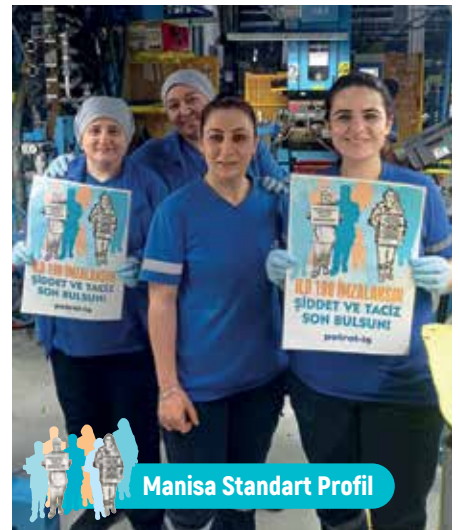
Manisa Standart Profil