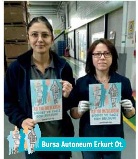
Bursa Autoneum Erkurt Ot.