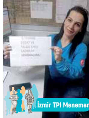
İzmir TPI Menemen