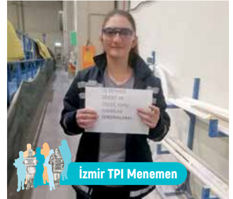
İzmir TPI Menemen