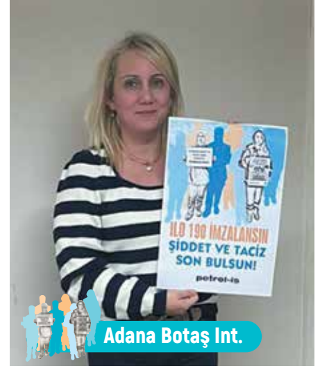
Adana Botaş Int.