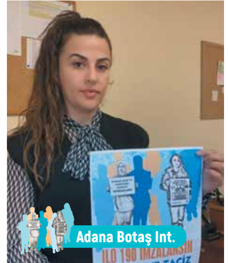
Adana Botaş Int.