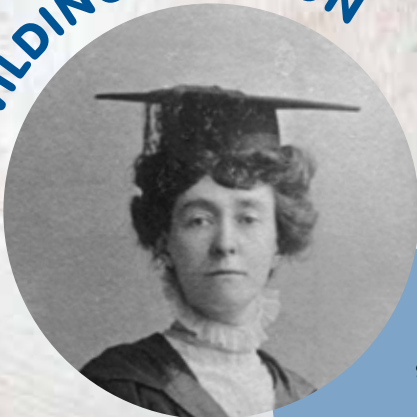
EMILY WILDING DAVISON

Osmanlı Hanedanı'ndan Divan tertip etmiş tek kadın şairi Adile Sultan Topkapı Sarayı'nda dünyaya geldi. (Ölüm: 12 Şubat 1898)