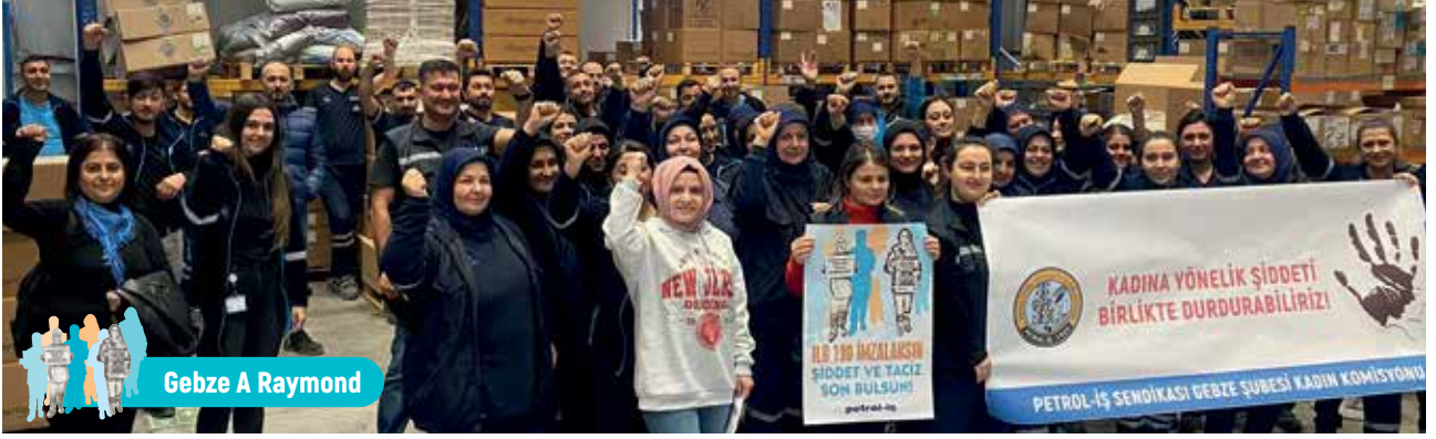
Gebze A Raymond