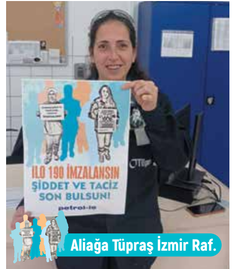
Aliğa Tüpraş İzmir Raf.