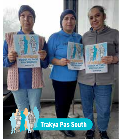
Trakya Pas South