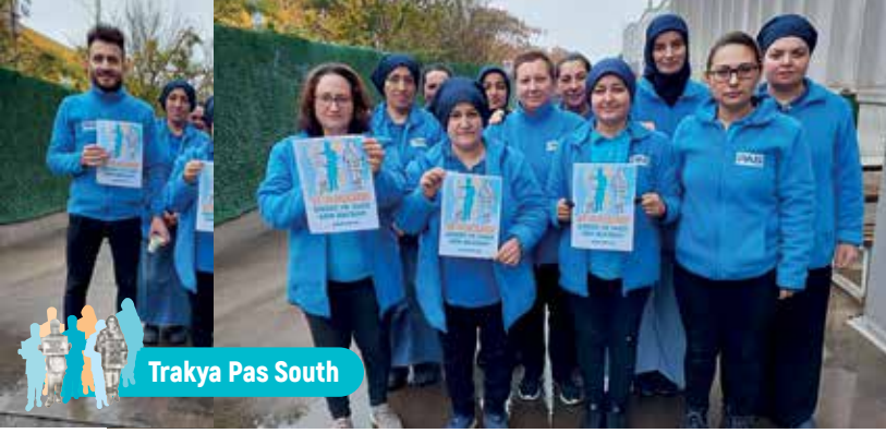
Trakya Pas South