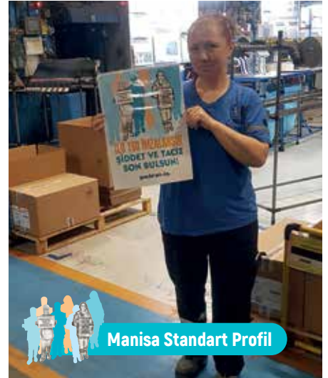
Manisa Standart Profil