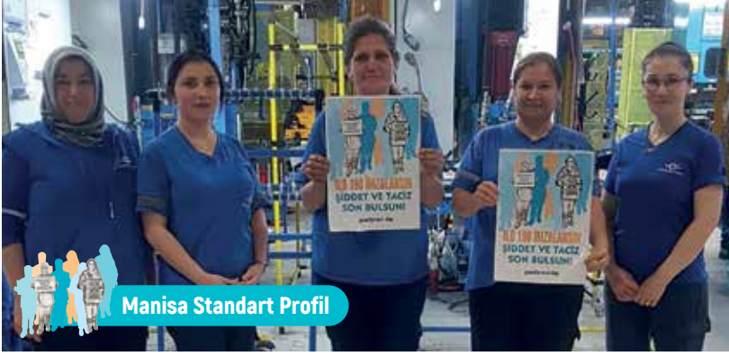
Manisa Standart Profil