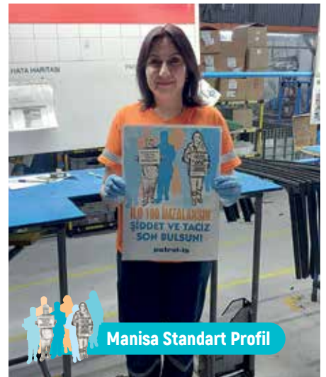
Manisa Standart Profil