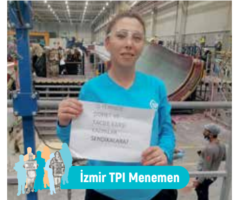
İzmir TPI Menemen