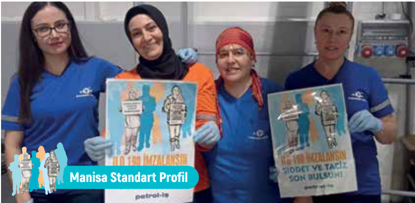
Manisa Standart Profil