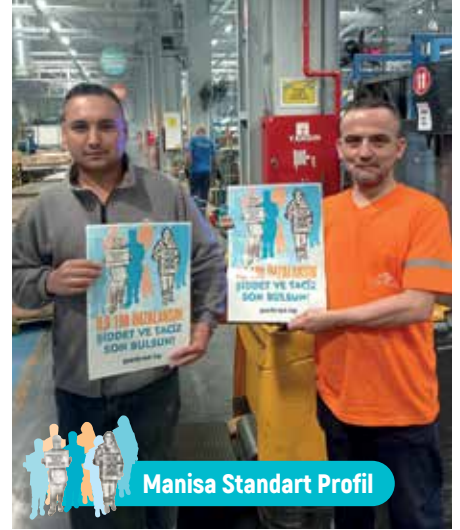
Manisa Standart Profil