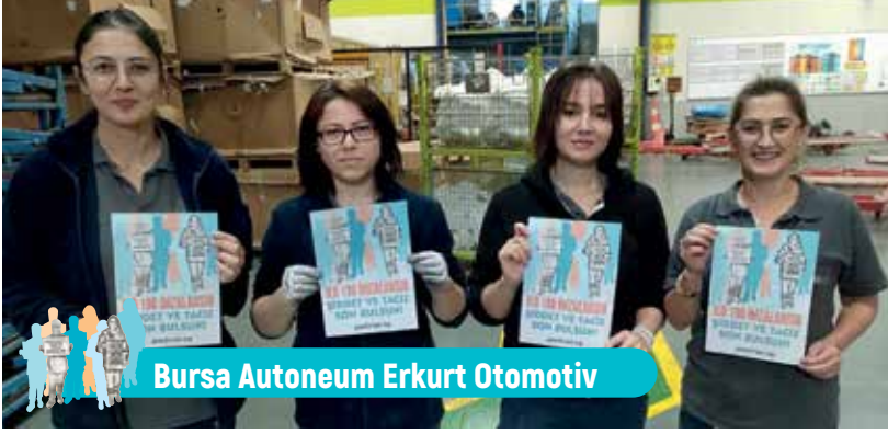
Bursa Autoneum Erkurt Otomotiv