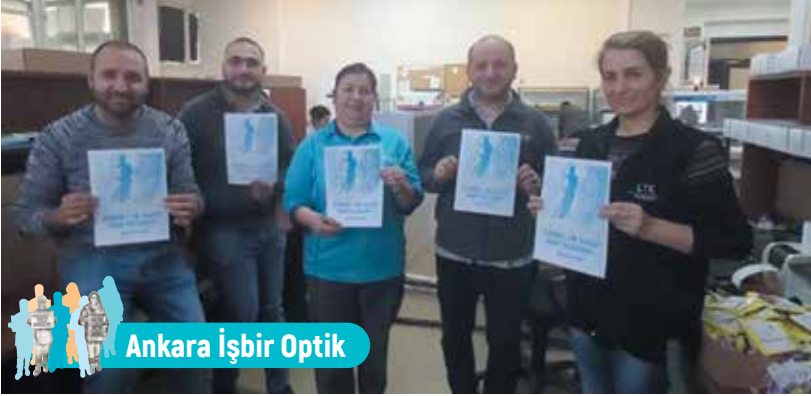
Ankara İşbir Optik