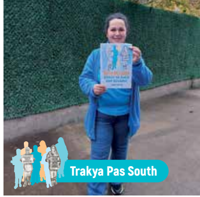
Trakya Pas South