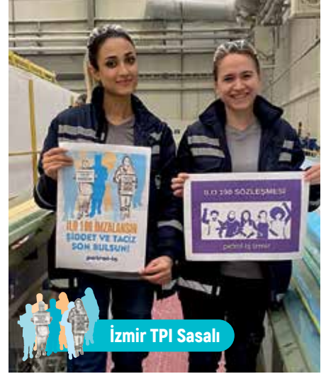
İzmir TPI Sasalı