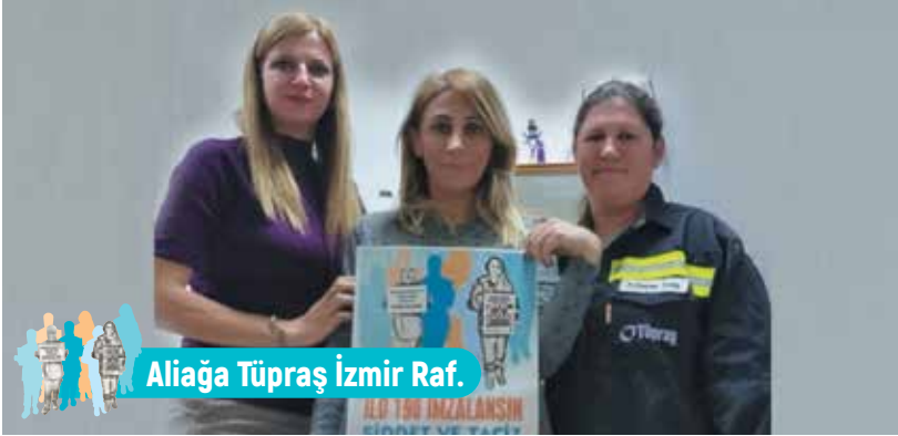
Aliğa Tüpraş İzmir Raf.