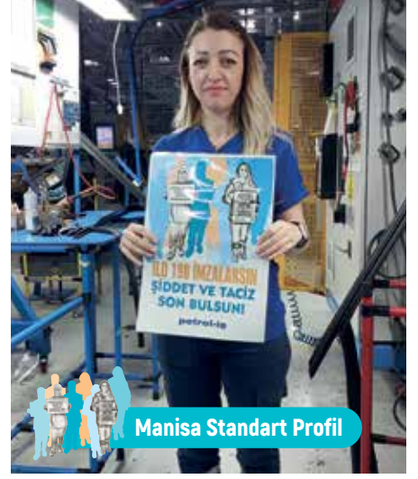
Manisa Standart Profil