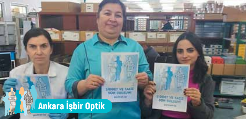
Ankara İşbir Optik