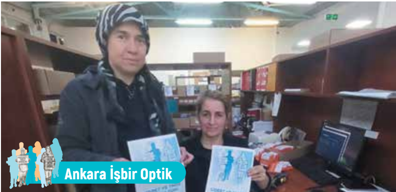
Ankara İşbir Optik