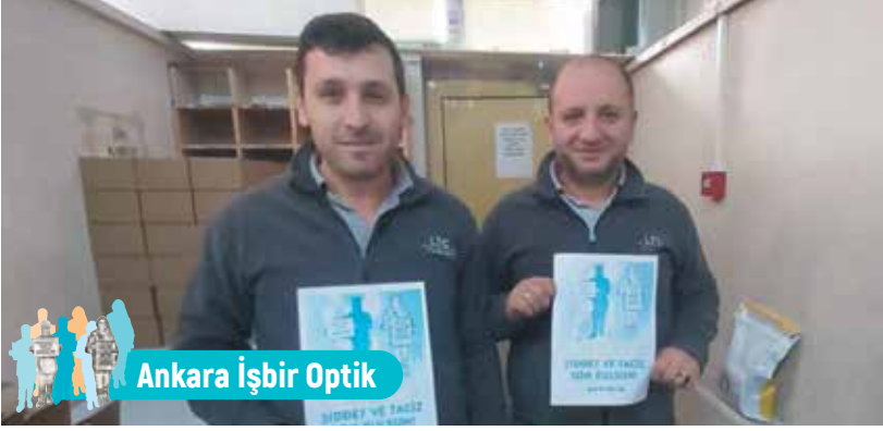
Ankara İşbir Optik