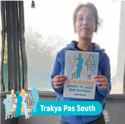
Trakya Pas South