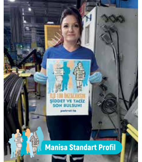
Manisa Standart Profil