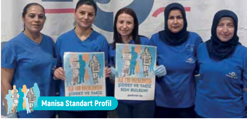
Manisa Standart Profil