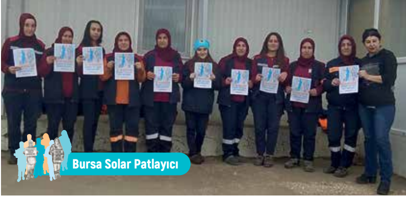
Bursa Solar Patlayıcı